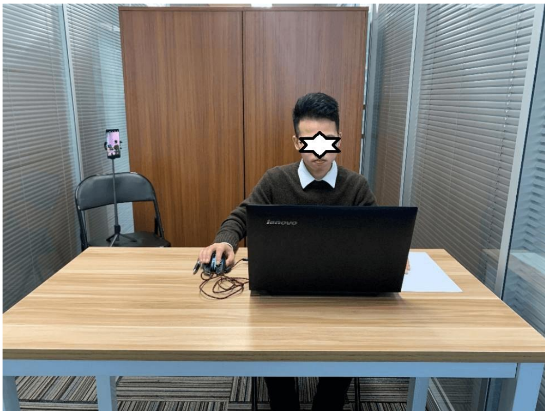
图一：笔试电脑端正面视角

同时应在考试坐位的后侧面设置合适的放置移动设备（手机或平板）的位置，保证移动设备能够从后侧面拍摄到考生桌面、笔记本电脑屏幕、周围环境及考生考试全过程。