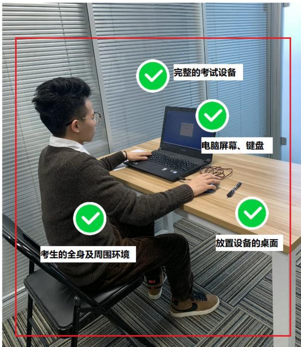
图二：佐证视频监控视角